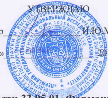
Таблица соответствия компетенций ФГОС ВО и СУОС+ по специальности 33.05.01 - Фармация