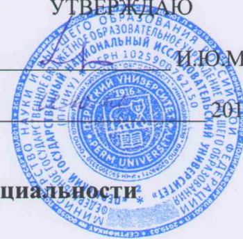
Таблица соответствия компетенций ФГОС ВО и СУОС+ по специальности 04.05.01 Фундаментальная и прикладная химия