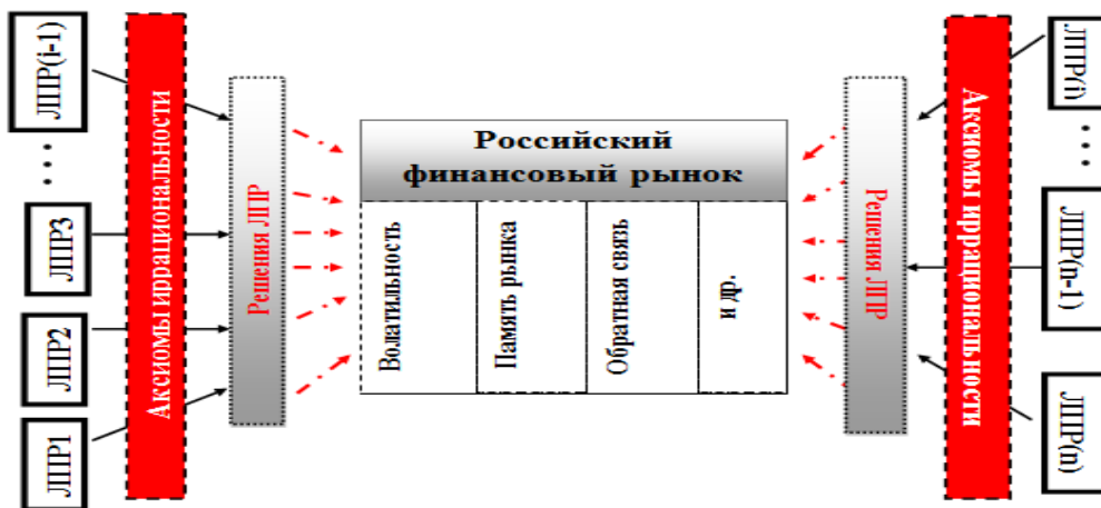
Рис. 1.7. Взаимосвязь особенностей поведения инвесторов и характеристик рынка