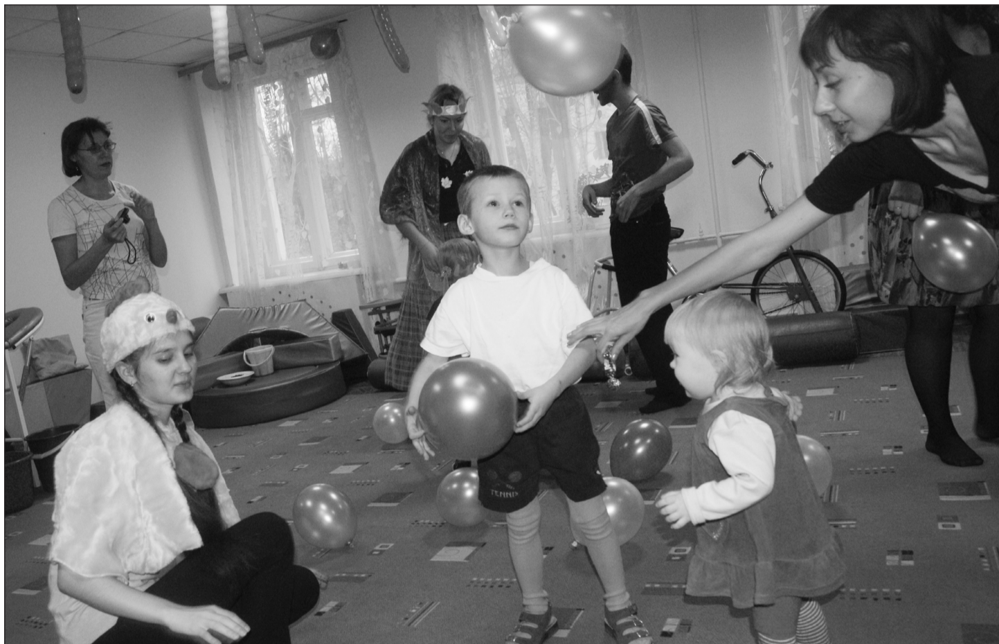
В октябре волонтеры юрфака организовали «Осенний праздник» для детишек из Краевого центра реабилитации инвалидов