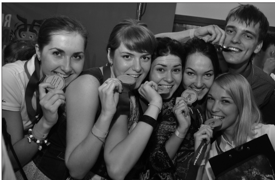
Наши ребята знают вкус побед: радуются выигранному гранту фонда В. Потанина на реализацию проекта «Право есть!»

«Право есть» началось с лекции экспертов