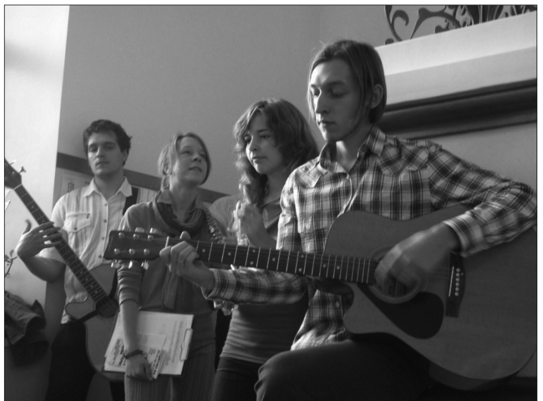
Площадка Клуба авторской песни на акции «Ночь в университете»

– Клуб авторской песни привлек мое внимание, потому что я люблю выступать, а тут появилась такая возможность, меня пригласили мои друзья.