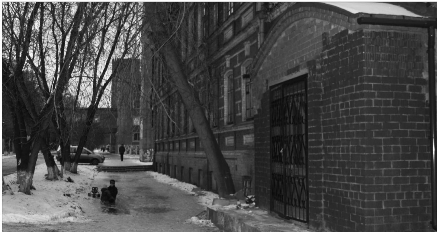
Уже скоро это безликое здание преобразится в новое университетское кафе «OLD SCHOOL»

Наша редакция обязательно забежит в «OLD SCHOOL» выпить чашечку кофе и обсудить новый выпуск газеты. Кто с нами?