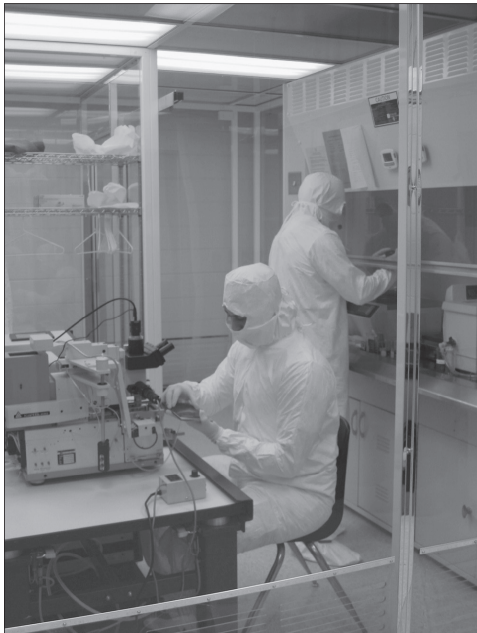
Ученые и студенты университета, занимающиеся наноразработками, работают в суперсовременных лабораториях

– Схемы создаются на ниобате лития и объединяют в себе оптические и электронные компоненты. Такие схемы позволяют управлять с помощью электроники световыми импульсами и преобразовывать их, в свою очередь, обратно в электронные импульсы. Это позволяет делать навигационные приборы нового поколения, что принципиально необходимо для производства военной и гражданской техники, в том числе надводных и подводных судов, авиации, космической техники. Производство интегрально-оптических