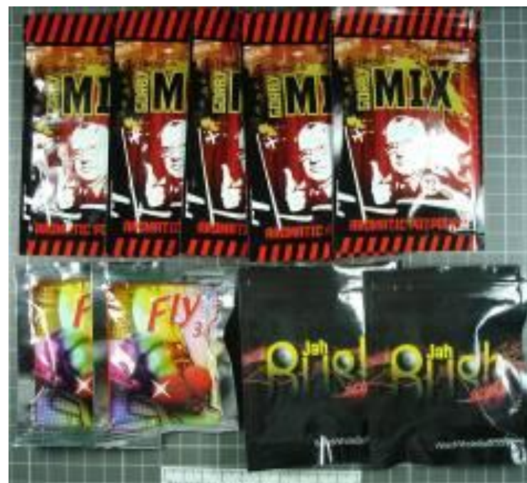
Внешний вид упаковки курительных смесей

Курительные смеси – «Спайс», «Микс», в состав которых входят лист шалфея предсказателей, семена розы гавайской, цветки и листья голубого лотоса, синтетические каннабиноиды. Внесены в список I Перечня наркотических средств, психотропных веществ и их прекурсоров, подлежащих контролю в Российской Федерации.