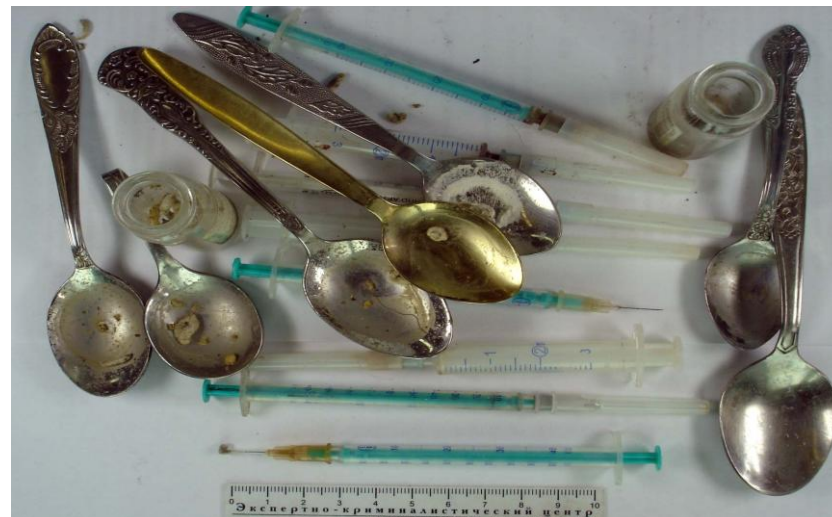
Предметы для приготовления и инъекционного употребления наркотических веществ