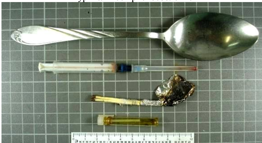
Предметы для приготовления и инъекционного употребления наркотических веществ