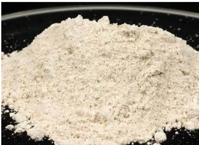
Амфетамин в порошковой форме

Дезоморфин – кустарно изготавливаемый наркотик из лекарственных препаратов (Коделак, Пенталгин, Пиралгин, Седалгин-М, Седалгин-нео, Терпинкод, Тетралгин). При его производстве могут использоваться простое оборудование и приспособления (стеклянные колбы, мензурки).