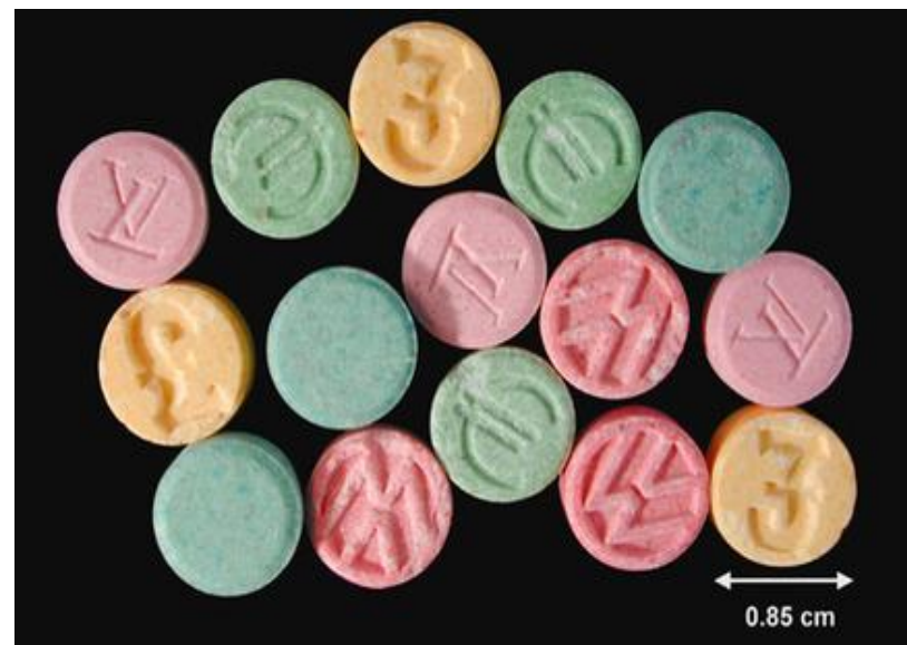
Экстази с таблетированной форме с отрисками различного вида

Экстази – общее название для группы синтетических наркотиков-стимуляторов амфетаминной группы, часто с галлюциногенным эффектом. Белые, коричневые, розовые, желтые или разноцветные таблетки, часто с рисунками. Капсулы содержат около 150 мг препарата.