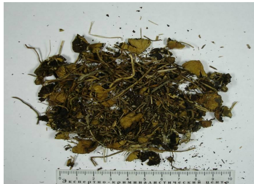
Грибы в засушенном виде

Амфетамин — наркотик, обладающий психостимулирующим, «возбуждающим» действием. К этой группе относятся синтетические вещества, содержащие соединения амфетамина. Встречается в виде таблеток и порошка.