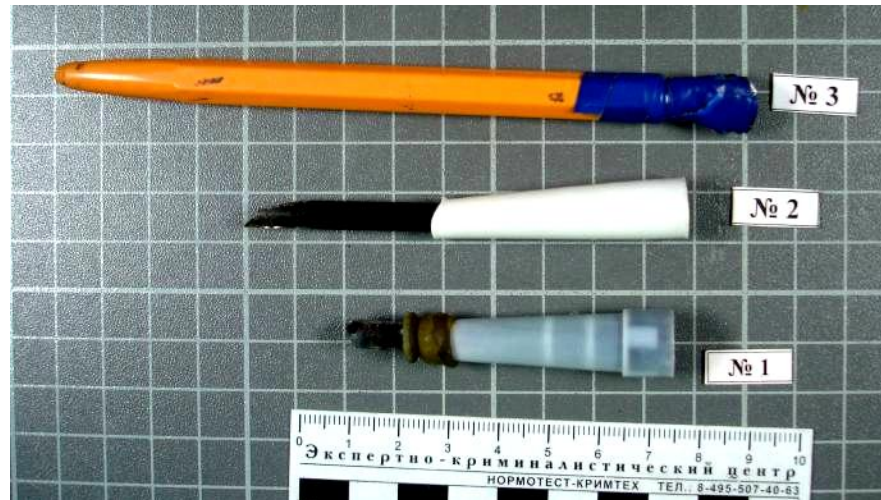
Самодельные мунштуки для курительного употребления наркотических средств