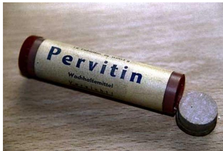
Первитин в таблетированной форме

Первитин – готовый к употреблению раствор, полученный в результате сложной химической реакции. Маслянистая жидкость, имеющая желтый либо прозрачный цвет.