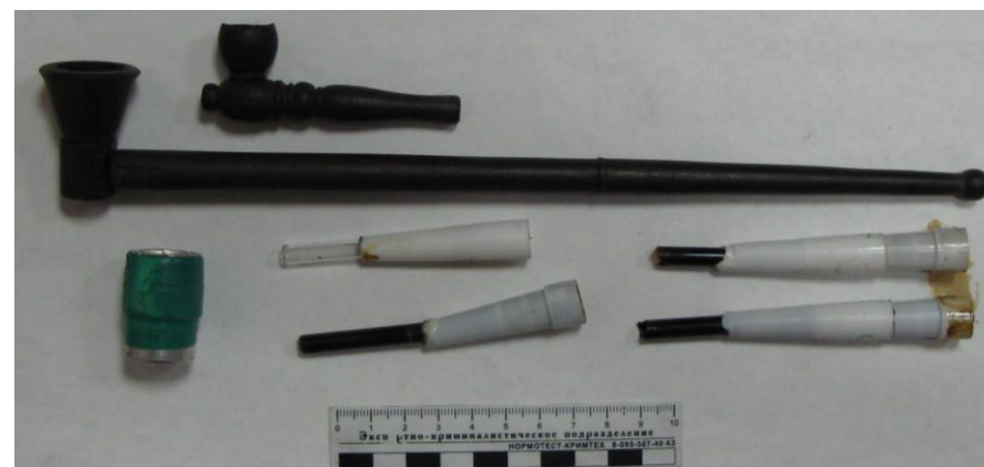
Курительные приспособления для употребления наркотических веществ