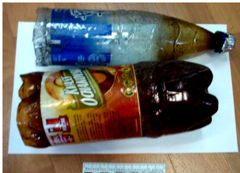
Самодельные приспособления для курения наркотических средств