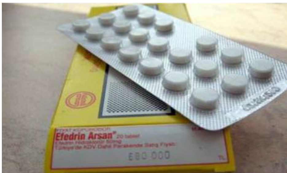
Наркотическое вещество эфедрин в таблетированной форме

При отсутствии средств на наркотики, наркозависимые лица могут принимать снотворные препараты .