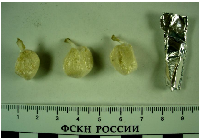
Наркотик в расфасованном виде (фольга, полиэтилен)