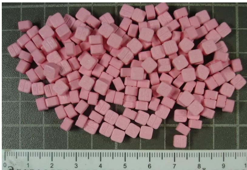
анаболические стероиды в таблетированной форме

В России свободная продажа части анаболиков запрещена. Они отнесены к сильнодействующим средствам и продаются строго по рецепту врача. Официально к анаболическим стероидам, содержащим в своем составе сильнодействующие вещества, в РФ отнесены 13 препаратов.