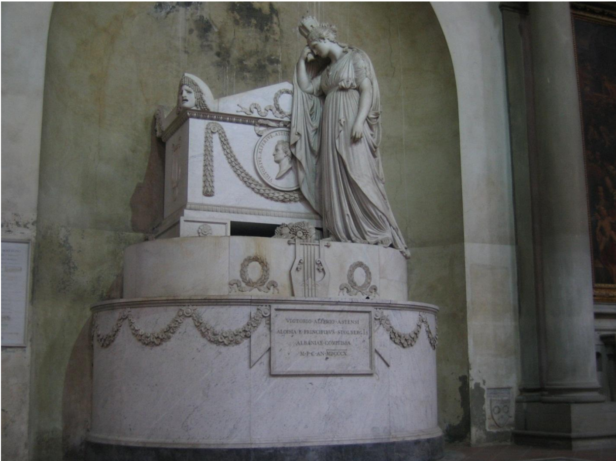
Figure 2. Antonio Canova. Tomb of Vittorio Alfieri ; Santa Croce, Florence, Italy.