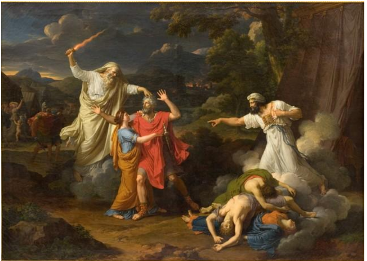
Figure 1. Francois Xavier Fabre. The Vision of Saul . 1803. Musee Fabre. Montpellier, France.

Foscolo's invocation of the eternal feminine recalls the relationship between the poet Dante and his beloved Beatrice. Conjuring up her image from the ashes of hell in Of Tombs causes the heavenly gates of St. Peter's to materialize before him. Her presence becomes a chimera of female deities that coalesce to form the concept of the divine from the depths of hell: "I pray the Muses help me call up heroes" [24]. She is the creative nationalist force that conjures the male divine at a time of national crisis. It is the same spirit that causes the Greeks to defeat the Trojans, but withheld their victory from Ulysses on his journey of exile and not home. Foscolo credits the female nymph whose union with Jove produced the fifty sons of Priam, the king of Troy, for producing the Roman Julian line. The Muses "makes the deserts glad with song/ and overcome the silence of a thousand centuries" [25]. The tomb then becomes a receptacle for the soul and the ashes from which the soul is called forth to assume new more fantastic forms for future generations of patriots who protect its sacred soil.