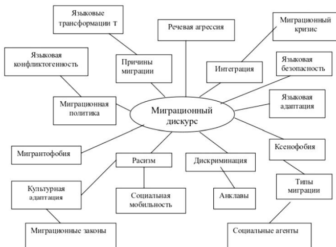
Схема 2. Модули миграционного дискурса (по Е. О. Зубаревой 2019: 38)

Критический анализ миграционного дискурса включает изучение способов выражения идеологии, которая основывается на фундаментальных общественных представлениях различных групп: расистов, антирасистов, пацифистов, милитаристов, феминисток, сексистов, неолибералов, социалистов и т. д. [Dijk 2018: 230]. Е. О. Зубарева представляет систему модулей миграционного дискурса, которая представлена на схеме 2 [Зубарева 2019: 38].