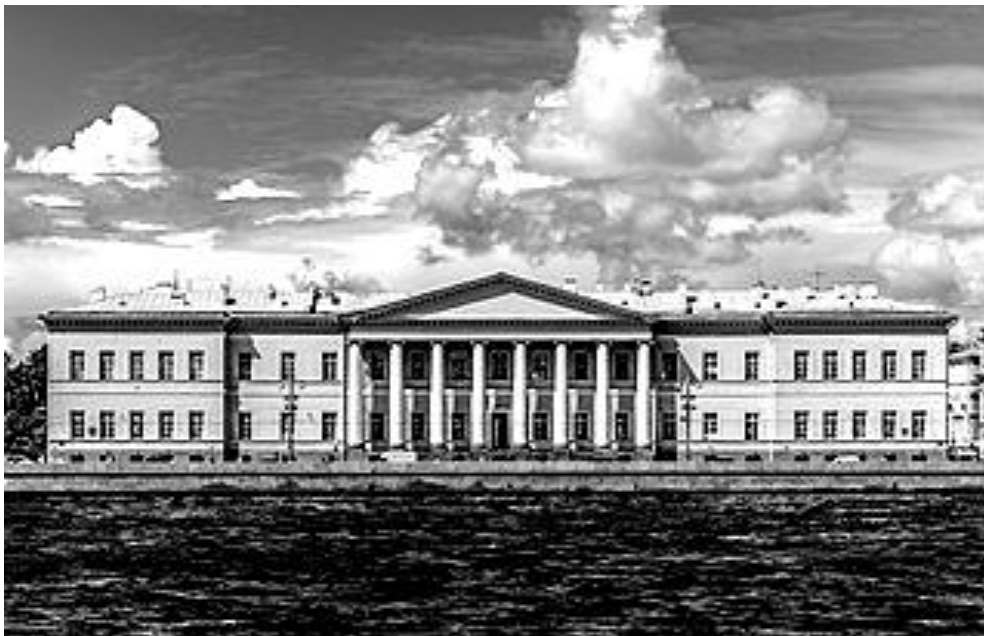
Здание Петербургской академии наук на Васильевском острове