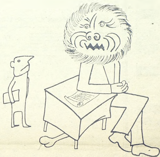
2. Экзаменатор — друг, желающий поговорить по душам.