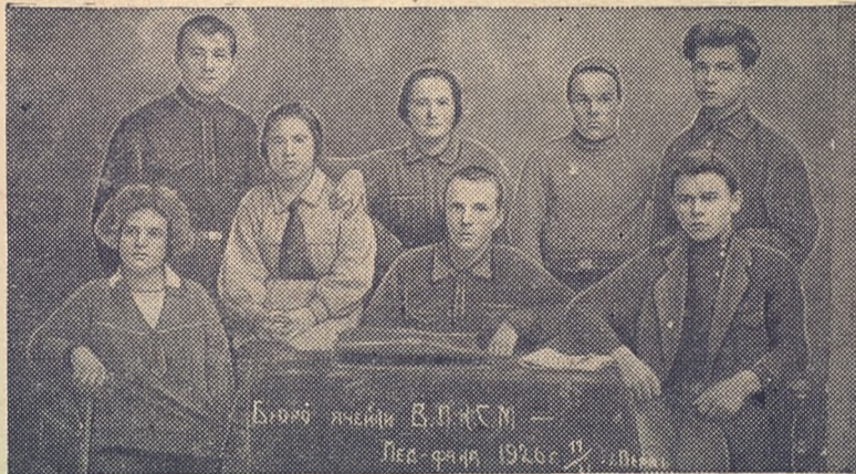
Первый ячейки ВЛКСМ — Пермский университет, 1924 г.

Когда день принахмурит брови, Присутлится тень в углу, Ты садишься зачет готовить, Напрягая до боли ум. И глаза, как глубокий омут, Блещут синью в шеренге строк. Цифры жгучие в формулах тонут, Карандаш танцует фокстрот. Запятыми легли две складки Возле девичьих сжатых губ, Зло поглядывает из тетрадки На тебя неизвестный икс-куб. Утром, в гуле аудиторий, Ты сдавать принесешь свой труд, За алгебраические дроби Педагоги поставят ВУД. А потом ты хвастнешь украдкой Своей матери на завод, Что учеба идет так гладко, Как и ткацкий ее станок. Мать, поглубже запрятав гордость, Запоет под пристук машин... Ей на миг возвратится молодость И разгладит ряды морщин. Студент В. С. ЦВЕТКОВ, 1929 г.