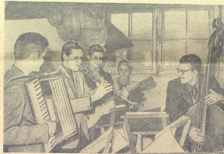
Сенстет готовит новую программу к смотру художественной самодеятельности.