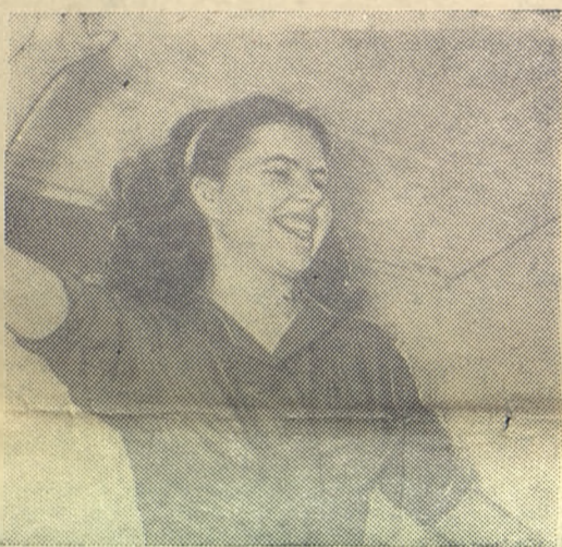
— Девчонки, сегодня я сдала последний экзамен!