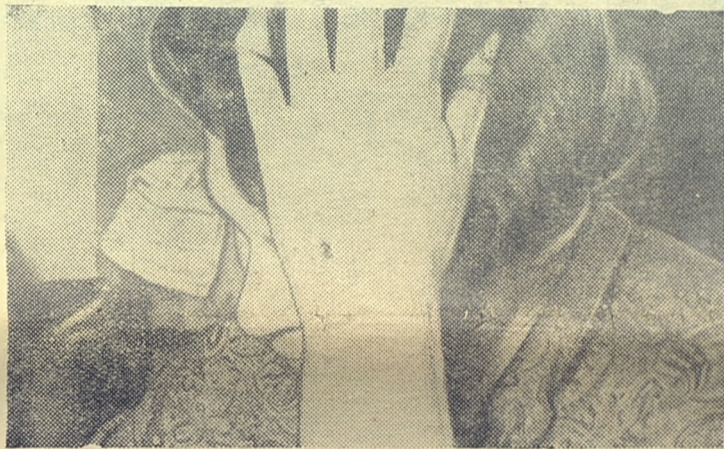
Три часа ночи. Но спать некогда: завтра экзамен.