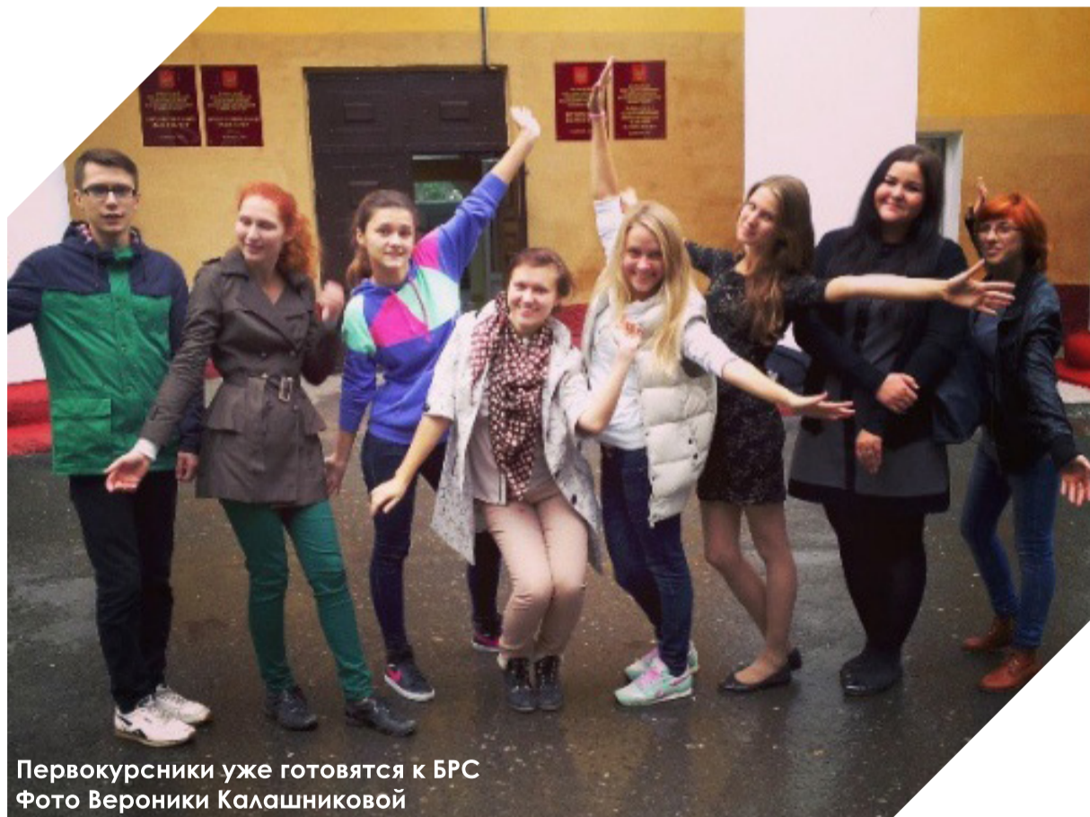
Первокурсники уже готовятся к БРС