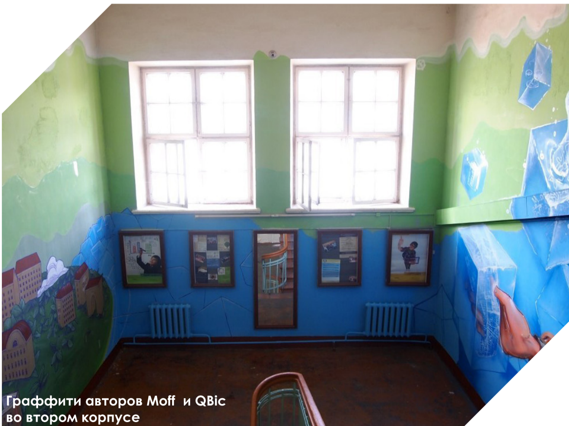
Граффити авторов Moff и QVic во втором корпусе