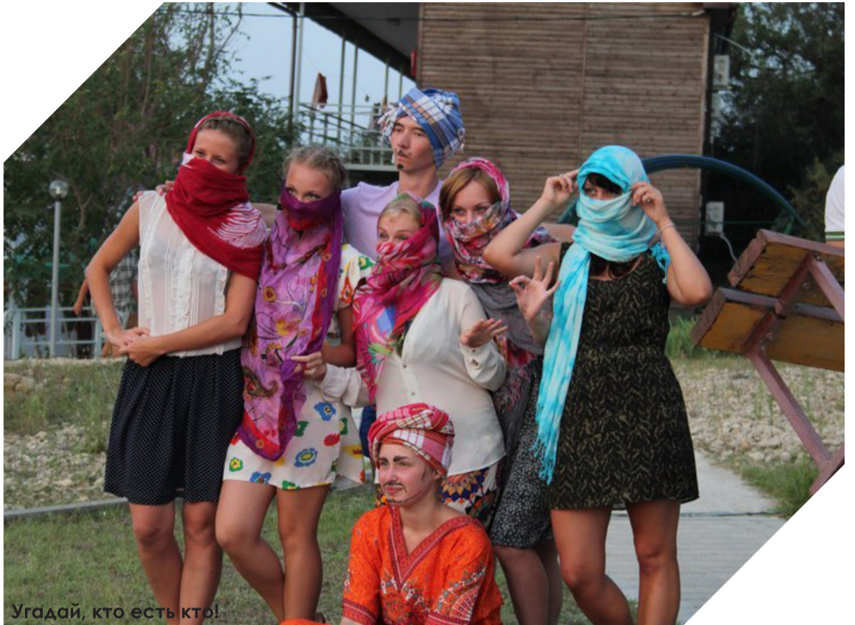
Угадай, кто есть кто!

” Море в этом году можно были действительно назвать супом с морепродуктами. Повсюду водоросли и медузы ”