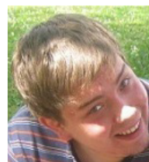
Опрос проводил Николай Ильиных, ТПЛ-11

Главным событием для меня стало, конечно, возвращение в университет. Банально, конечно, но встреча со старыми знакомыми и друзьями вызывает всплеск эндорфинов и непередаваемые эмоции. Я соскучилась по универу, по людям, без которых невозможно его представить, по выступлениям и студклубу — список можно продолжать дальше, но я не буду. Я просто рада вернуться в универ.