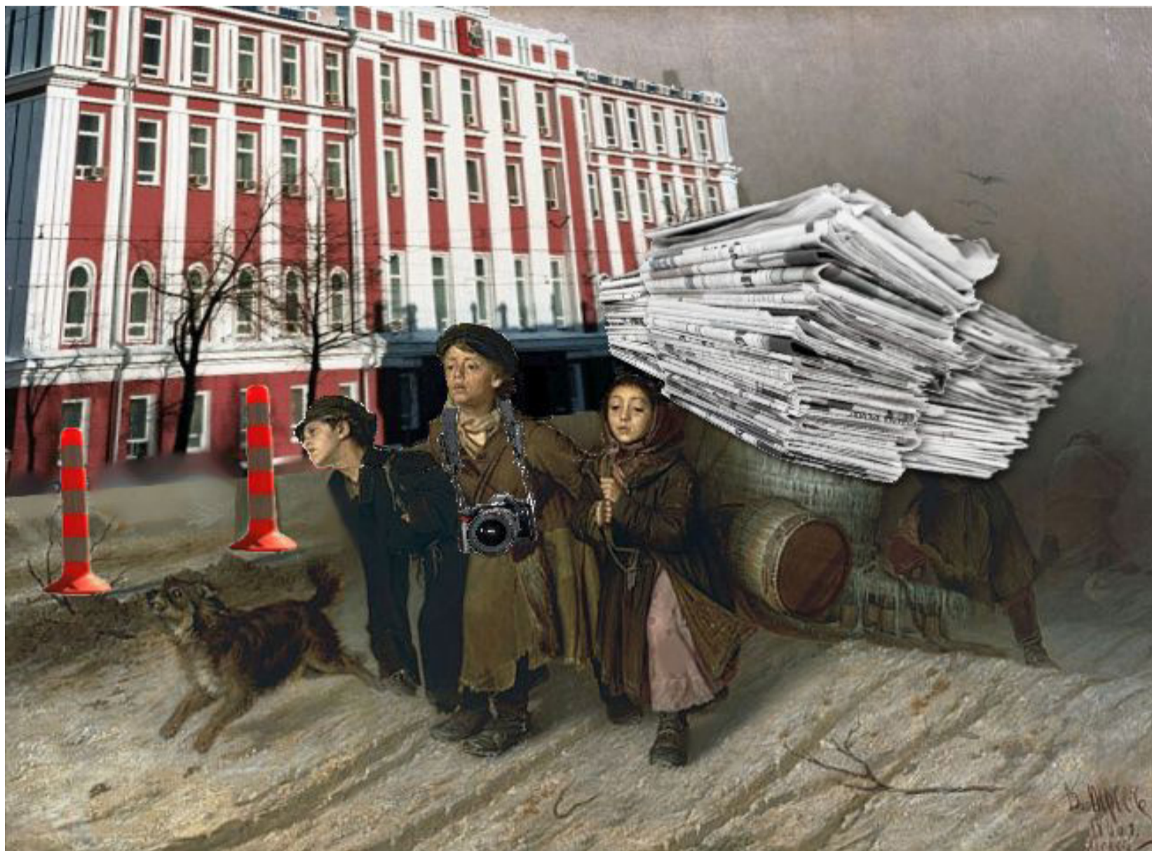
Журналисты-практиканты возвращаются в редакцию с новостями из Городской Думы. Коллаж Ульяны Тресковой