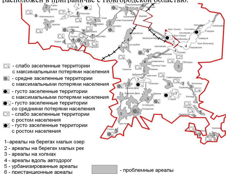
Рис. Ареалы типов расселения, ареалы плотности населения и динамики численности населения Фировского района Тверской области в 1959 – 2010 гг. (фрагмент) [2].

Обезлюдение сельских населённых пунктов, разрушение сельских систем расселения и сжатие освоенного пространства являются одними из наиболее проблемных аспектов социально-экономического развития периферийных районов центральной России. В нашем исследовании приведена оценка устойчивости сельского расселения на примере Фировского района Тверской области. Административный центр района – пгт Фирово удалён от Твери на 200 км; район расположен в приграничье с Новгородской областью.