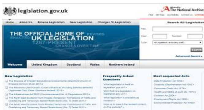
Рис. 1. Главная страница государственного портала правовой информации Великобритании

Законодательство Великобритании как государственного, так и регионального уровней, размещено на портале «Legislation.gov.uk» по адресу http://www.legislation.gov.uk/browse , (см. рис. 1), где представлен перечень всех нормативно-правовых актов, а также их полные тексты со всеми изменениями и дополнениями 1 .